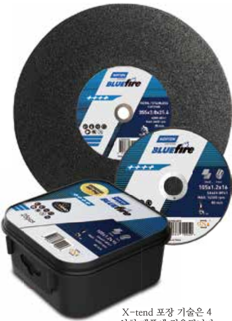
X-tend 포장 기술은 4 인치 제품에 적용됩니다